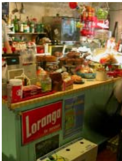
Disken inne på Hugos där du finner massor med mumsigheter.

Hugos stil är enkel men modern. Här hittar du massor med olika kafesorter från olika delar av världen, enkel mat, har också glutenfria och mjölkfria alternativ.