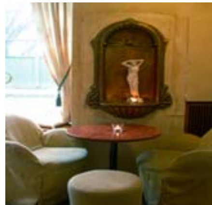
Koppla av här inne på Cappuccino med dina kompisar.