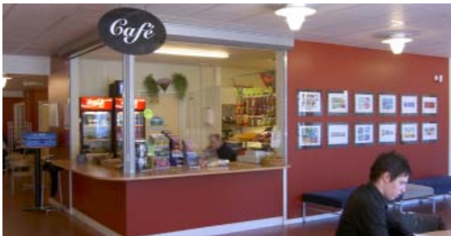
Kioskdelen av Awats café.

Men Awat har planer på förändring om eleverna vill. Istället för att köpa en chokladkaka om man är hungrig, ska det bli mer nyttiga alternativ som sallader, yoghurt, frukt. Det ska bli mindre socker, genom att minska godisutbud.