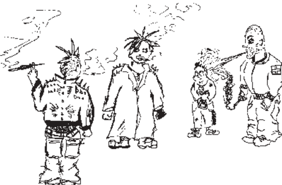
Gymnasiet är inte lika farligt som i dina drömmar