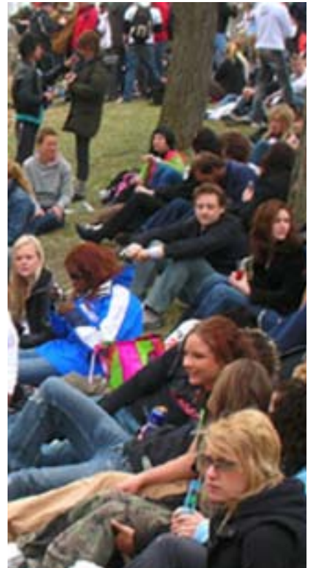
Slottsbacken under ett lite gråmulet Valborgsfirande.

ungdomar som både ska planera och arrangera de olika evenemangen som tar plats i lokalen. Grand ligger på Trädgårdsgatan 5 inne i stan. Här är det alltid drog-fritt.