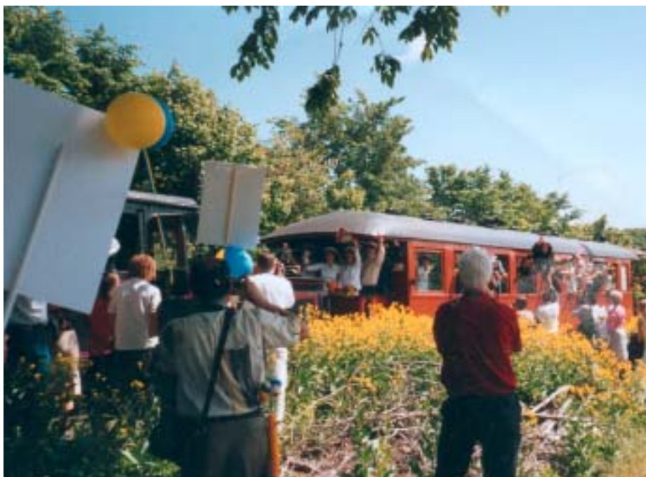
Studenterna hänger ut genom fönstren under färden med Lännakatten.

Dagen börjar tidigt på morgonen. Du kanske tar en liten egen champagnefrukost hemma innan du åker till skolan runt nio. Sedan möter du alla dina studentvänner i skolan med kramar och skrik. Alla studenter äter frukost tillsammans och dricker en hel del till (kanske inte så alkoholfria drycker). Alla är glada och studentkortet knäpps. Sedan bär tåget av. Att man tillsammans hoppar på Lännakatten och åker ner med till stationen har varit en tradition på GUC i två år nu. Lännakatten är ett gammalt godståg som numera ba-