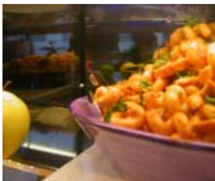
Varför inte köpa en god och dyr pasta att äta?