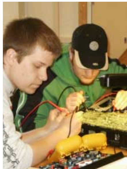
Två medieteknikertreor hjälps åt att laga en videobandspelare.